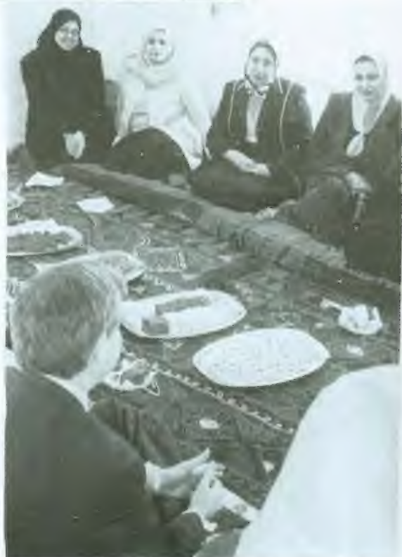
افتتاح المركز النسائي ببغداد في يوم المرأة العالمي، 8 آذار/مارس 2004